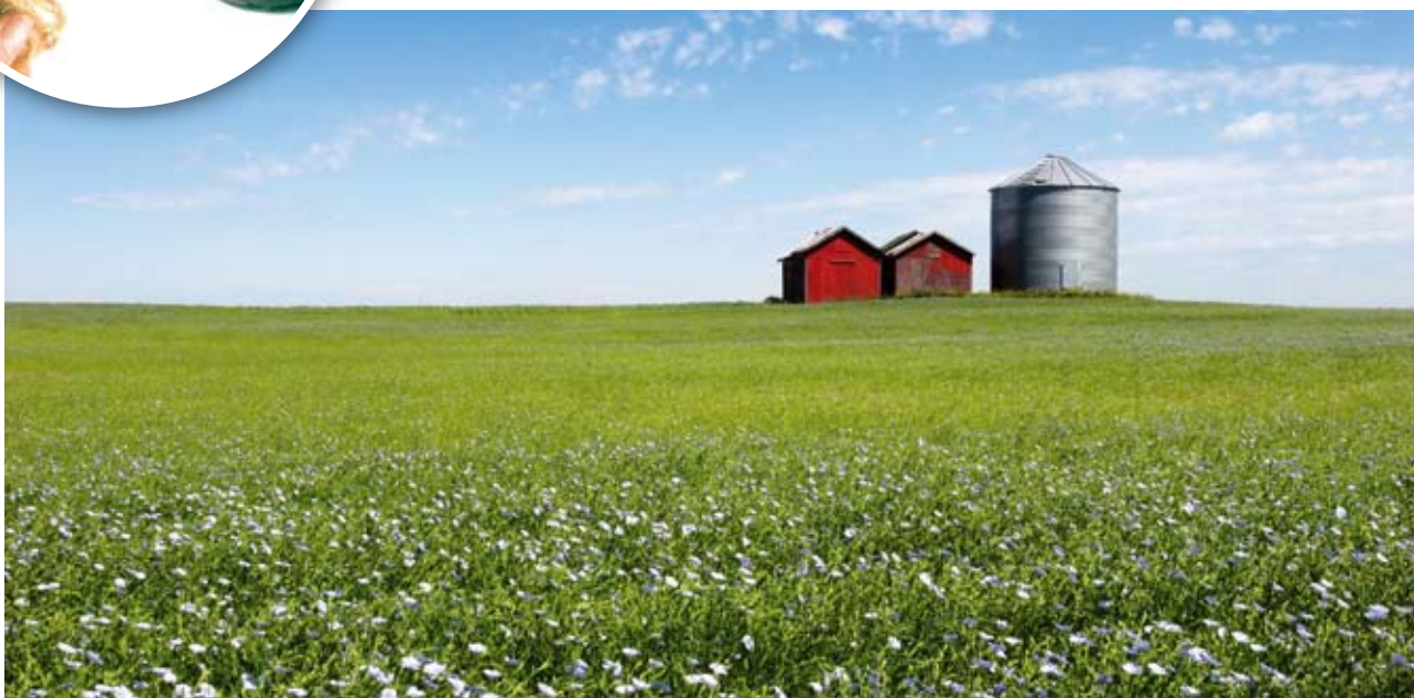
Champ de lin