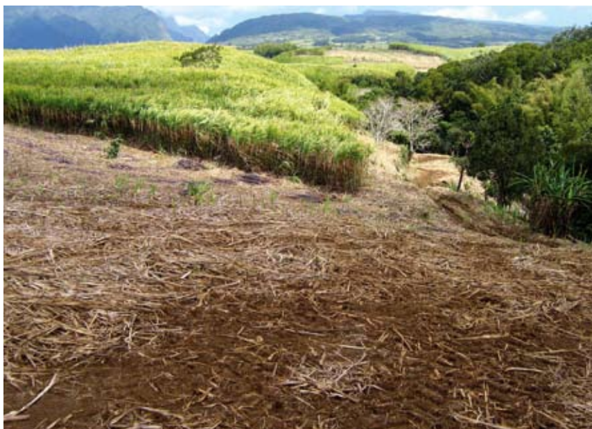
Récolte de Canne à sucre