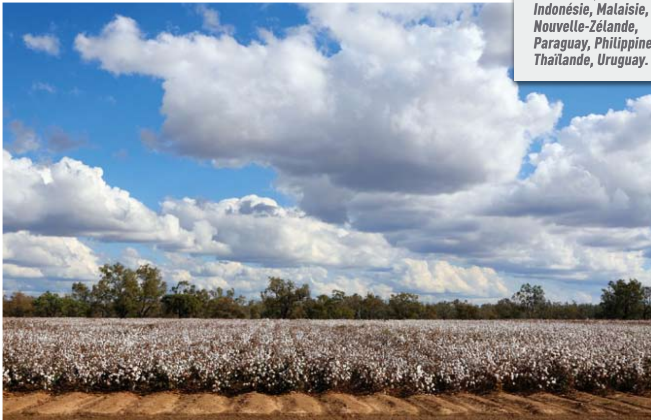
Champ de coton